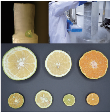
茎頂や腋芽を超低温で保存することができれば、接木によって親個体と同じゲノムを持った植物を再生することができる。