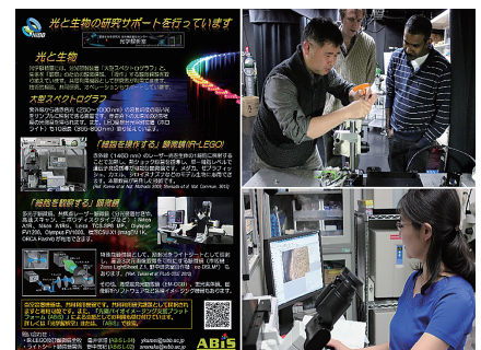
図 2. バイオイメーシング解析室のリーフレットならびに特殊な顕微鏡を使った共同利用研究の様子（右上ライトシート顕微鏡、右下 IR-LEGO 顕微鏡）