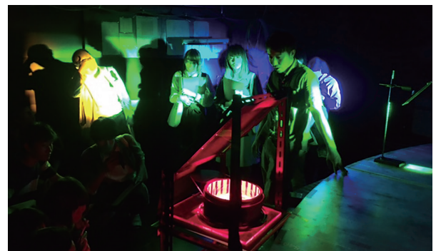
図 1. 大型スペクトログラフを使った魚類色覚実験（中央の赤色縞が回転し、魚が追従運動する様子を下側から撮像して解析）の見学