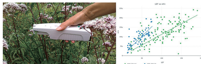
図3. 野外測定用分光光度計 (MultispeQ) による測定と解析例

太陽系外惑星での植物特性を検討する手がかりを得るため、様々な自然環境下で多様な植物の光合成反応測定を実施している。可視光より近赤外線が多い林床において、豊富な近赤外線は光合成の生産性向上には寄与しないが、変動光への適応のために利用されている。