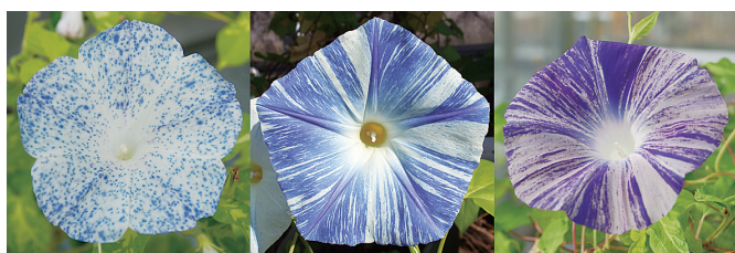
ゲノムが変化することで現れるアサガオの模様