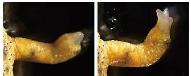
図 2. イベリアトゲイモリの四肢再生。左図のように四肢を失っても、1～2ヶ月程度で元に戻る。

両生類が持つ組織再構築能力のメカニズムの解明は、基礎生物学のみならず再生医学への大きな貢献が期待される。現在、我々のグループでは上述の "Reading" によってもたらされる情報を基に、"Editing" 技術を駆使し、両生類の "Reconstructing" 能力の謎を解き明かすべく日々努力している。