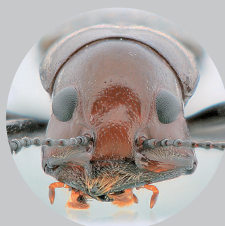
ニホンホホビロコメツキモドキ