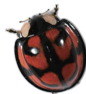
カメノコテントウ

100万種以上にも及ぶ圧倒的な種数の豊富さを誇る昆虫は、4億年以上にわたる進化の歴史の中で、地球上のあらゆる環境に進出し、それぞれの種の棲息環境に適応した多様な形質を発達させてきた。そのような昆虫は、多様性の宝庫であり、多様性創出の進化メカニズムを解き明かすための研究材料として無限の可能性を秘めている。進化発生研究部門では、昆虫が進化の過程で獲得した翅や角などの新奇形質に着目し、昆虫の多様な形質をもたらす分子基盤および進化メカニズムを解明することを目指している。