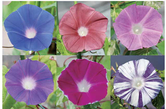
図1. 多彩なアサガオの花色 花色は色素の構造だけでなく、色素が蓄積する液胞内のpHに依存する。

240の花色に係わる突然変異系統、17万5千のDNAクローンや花弁特異的発現ベクター等を保存し、国内外の研究者に提供している。