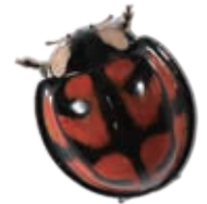
カメノコテントウ

100万種以上にも及ぶ圧倒的な種数の豊富さを誇る昆虫は、4億年以上にわたる進化の歴史の中で、地球上のあらゆる環境に進出し、それぞれの種の棲息環境に適応した多様な形質を発達させてきた。そのような昆虫は、多様性の宝庫であり、多様性創出の進化メカニズムを解き明かすための研究材料として無限の可能性を秘めている。進化発生研究部門では、昆虫が進化の過程で獲得した翅や角などの新奇形質に着目し、昆虫の多様な形質をもたらす分子基盤および進化メカニズムを解明することを目指している。