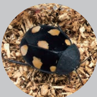
オレンジスポットドミノローチ