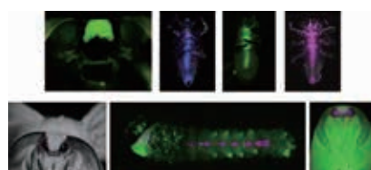
図 1. 形質転換ナミテントウ（上段）と形質転換カイコ（下段）

非モデル昆虫の興味深い現象を分子レベルで解明するためには、遺伝子機能解析ツールが必要不可欠となる。そこで、非モデル昆虫での遺伝子機能解析を実現するために独自に開発した形質転換体を利用した遺伝子機能解析系及び種々のRNAi法、ゲノム編集技術などの開発を行っている。