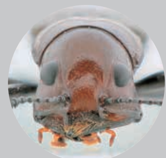
ニホンホホビロコメツキモドキ