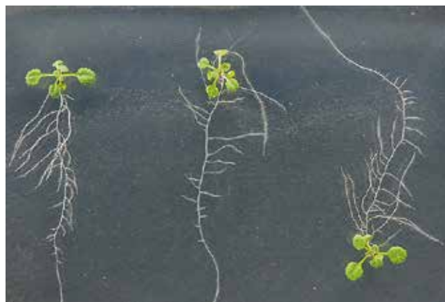
図2. シロイヌナズナの根の伸長方向の決定

重力方向へ移動したアミロプラストの位置情報が、どのようにオーキシン細胞間輸送制御へとつながるのかについては、未だに不明な点が多い。近年、私たちは重力感受細胞に着目したトランスクリプトーム解析から、花茎、胚軸、根全ての重力応答器官において、重力シグナリングに関与する遺伝子ファミリーの同定に成功した。この遺伝子ファミリーの発現量に依存して、根や側枝の伸長方向が決定されるらしい（図2）。現在、これら遺伝子の機能解析を行うことで、重力シグナリングと根や側枝の伸長方向決定の分子機構の解明を目指している。