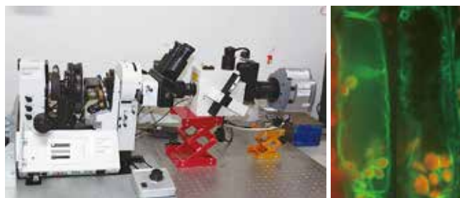
図1. 垂直ステージ共焦点レーザー顕微鏡で観察した内皮細胞

重力方向を感受する細胞である花茎の内皮細胞や根端のコルメラ細胞には、アミロプラストが存在している。アミロプラストが重力方向に移動することが重力方向の認識に関わり、液胞膜や細胞骨格の動態が適切に制御されることが、アミロプラストの重力方向への移動に重要である。私たちは、垂直ステージ共焦点顕微鏡を独自に構築し、重力方向の変化に伴う重力感受細胞のオルガネラやタンパク質動態を詳細に観察することで、重力感受メカニズムに迫ろうとしている。