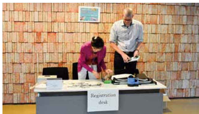
第10回基礎生物学研究所国際実習コース開催支援