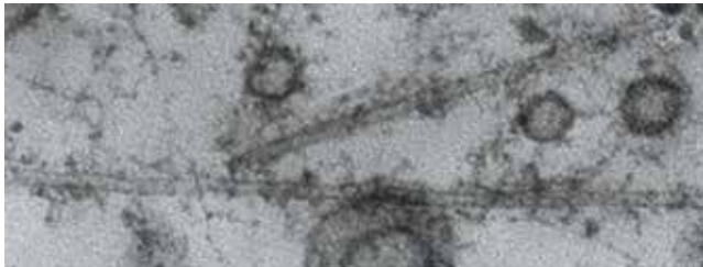
図1. タバコ培養細胞抽出液中で作らせた、分岐する微小管

細胞の基本的性質の違いは、多細胞生物の違いを生み出す源である。細胞分裂・伸長は微小管をはじめとする細胞骨格系によって制御されている。タンパク質の管である微小管がどのように生命現象へとつながっていくのか。物質と生命とのギャップを解明したい。