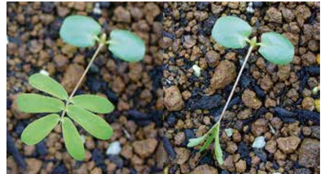
図2. オジギソウの運動機構、適応的意義はまだ解明されていない

2つのホームページで情報提供中 ( http://www.nibb.ac.jp/evodevo/tree/OO_index.html と http://www.nibb.ac.jp/plantdic/blog/ )。