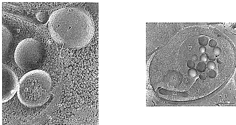
図1 飢餓条件下の液胞蛋白分解酵素欠損株のフリーズレプリカ像