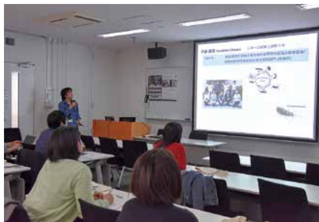
大学院説明会・大学院生による学生生活の紹介