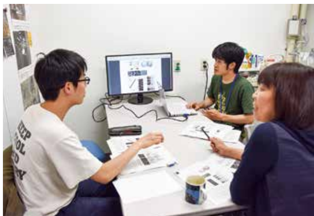
生物学英語論文読解コース