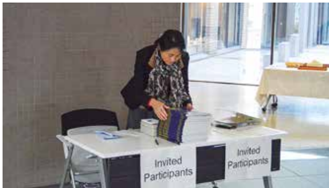
第65回NIBBコンファレンス開催支援

研究力強化戦略室国際連携グループでは、これら国際会議や実習コースの開催、研究者や学生の派遣、受け入れなど共同研究事業のサポートなどを通して、基礎生物学研究所の国際交流活動を支えている。