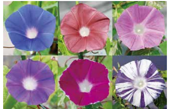
図 1. 多彩なアサガオの花色

色に係わる突然変異系統、6 万の EST クローン、11 万 5 千の BAC クローンを保存し、国内外の研究者に提供している。