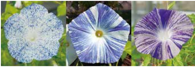
ゲノムの変化により現れるアサガオの模様