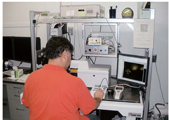
図 3. IR-LEGO を使った実験風景