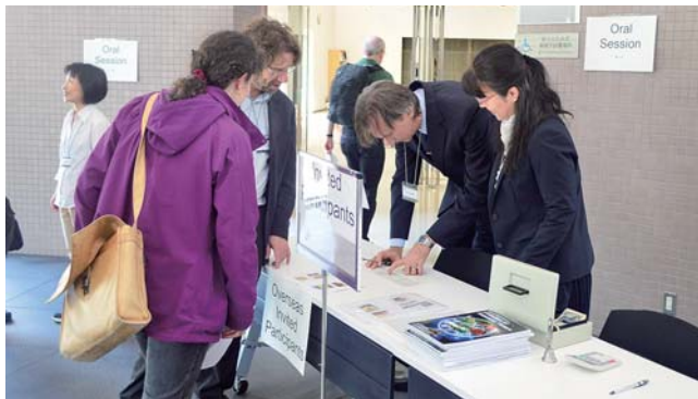
第64回NIBBコンファレンス開催支援

研究力強化戦略室国際連携グループでは、これら国際会議や実習コースの開催、研究者や学生の派遣、受け入れなど共同研究事業のサポートなどを通して、基礎生物学研究所の国際交流活動を支えている。