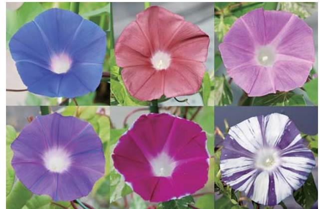
図 1. 多彩なアサガオの花色

連携して、その遂行を担っている。当研究室では 200 の花色に係わる突然変異系統、6 万の EST クローン、11 万 5 千の BAC クローンを保存し、国内外の研究者に提供している。