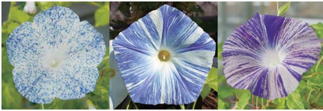
ゲノムの変化により現れるアサガオの模様