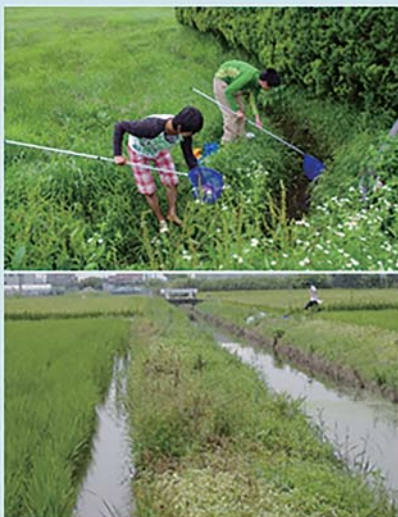
岩手県(上), 愛知県(下)の野生メダカの生息地。