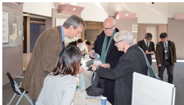
第63回NIBBコンファレンス開催支援