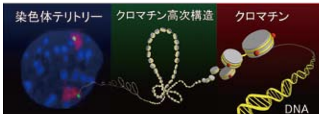
図1. 階層的なクロマチン高次構造 核内のクロマチンは組織化された構造をとる。

ゲノムDNAはヒストンというタンパク質に巻き付くことでクロマチンとして折り畳まれ、直径数 \mu\text{m} の核内にコンパクトに収納されています。そのクロマチン繊維は核内でランダムに存在するのではなく、階層的に組織化された構造をとっています(図1)。その立体的なクロマチン高次構造は、転写や複製などの様々な核内現象に深く関与していることが知られています。クロマチンの構造はその表現形に大きく関与しており、生体内に存在する様々な細胞種はそれぞれ特異的なクロマチン高次構造を有しています。